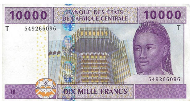
Billet de 10 000 francs CFA de la BEAC.