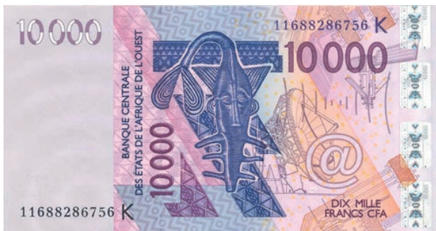
Billet de 10 000 francs CFA de la BCEAO.